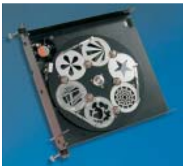
Einschub-Modul mit 6-fach Gobowechslers